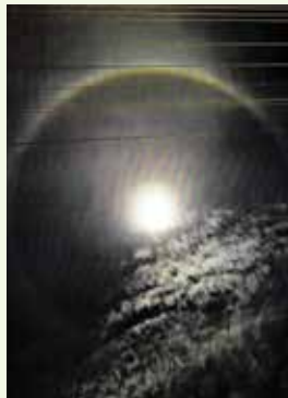
II Mención de honor: Alba Nidya Walsh Cortés. Fotografía: Luna con su lucero oculto.