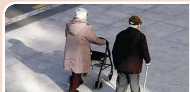
“AFUP frente a las diferentes situaciones que afectan las pensiones”