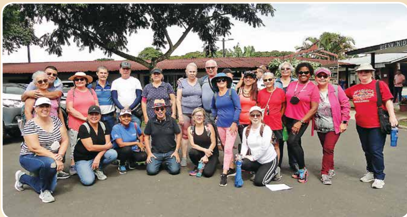
Visita Finca de la UNA.