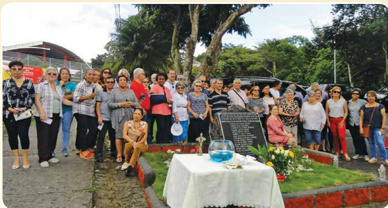
Homenaje a fallecidos en Cinchona 20/10/22.