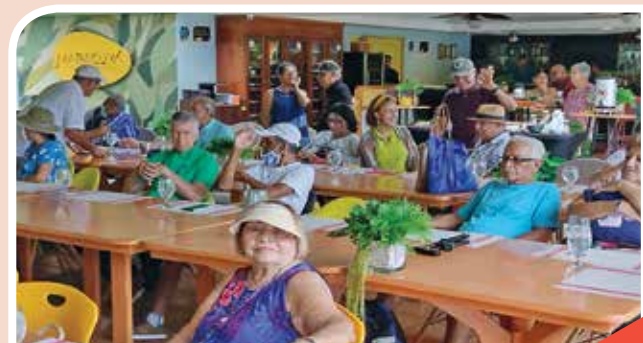
De las Filiales