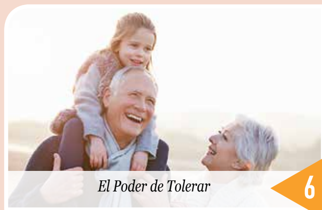
El Poder de Tolerar

Impresión Grupo Grafos Multiservicios SRL. Tel: +506 8392.89.91