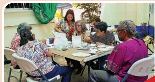
Feria de la Salud