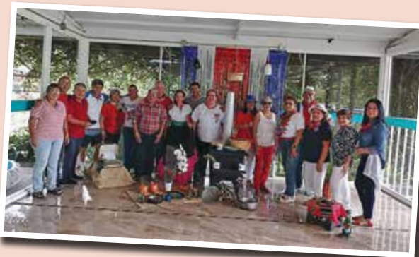
Conmemoración de la Independencia.