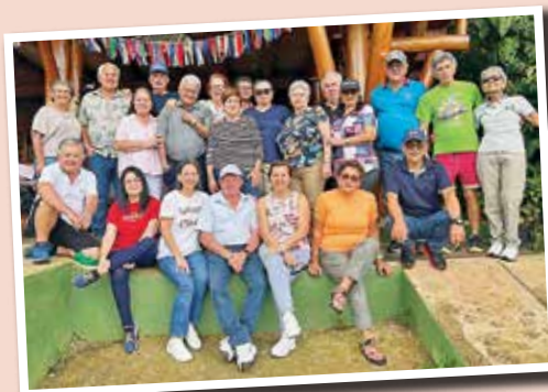
Día de la Persona Adulta Mayor desarrollado en Rancho Vistas del Pacífico.