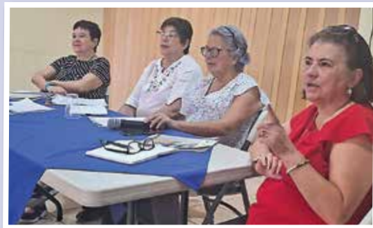
Reunión Ampliada de Junta Directiva.

En noviembre, nuestra segunda junta directiva ampliada, permitió comentar temas sensibles de mucho interés de la membresía, exponer informes del quehacer de la directiva y obtener de las presentes