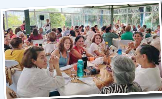
Celebración del Aniversario y del Día del Padre y del Día de la Madre.