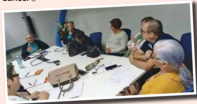
Articulación institucional con ADEP San Carlos.

Finalmente, el año cerrará con la tradicional Cena Bailable de fin de año, que se celebrará el 12 de diciembre en el Hotel Tucano, La Marina de San Carlos. ●