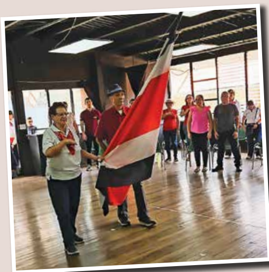
Turno de la Independencia.