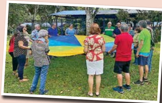
Actividades al aire libre en Rancho Vistas del Pacífico.