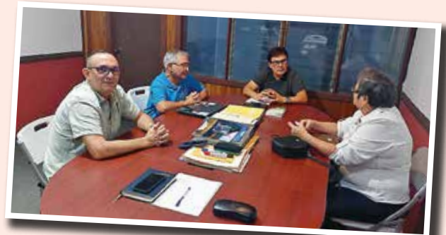
Reunión con el diputado Joaquín Hernández, para tratar temas de pensiones.