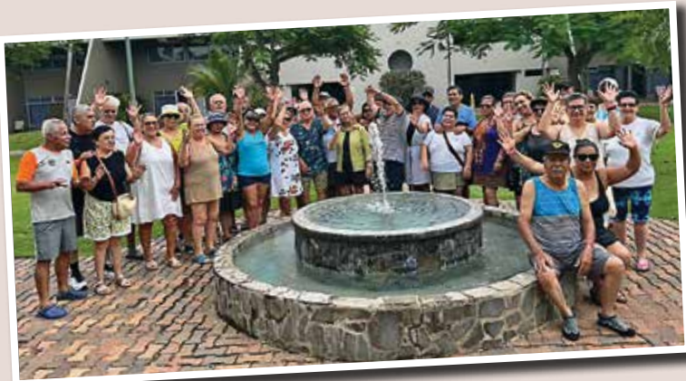
Paseo de larga distancia al Hotel Fiesta.

Lorena Casasola Hernández, corresponsal Filial Cartago