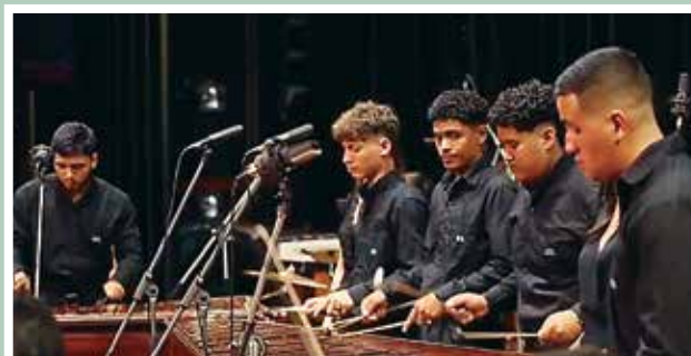
Las etapas básicas de la enseñanza de la música en la UCR