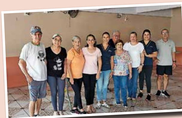
Afiliados y afiliadas que concluyeron el reto nutricional.