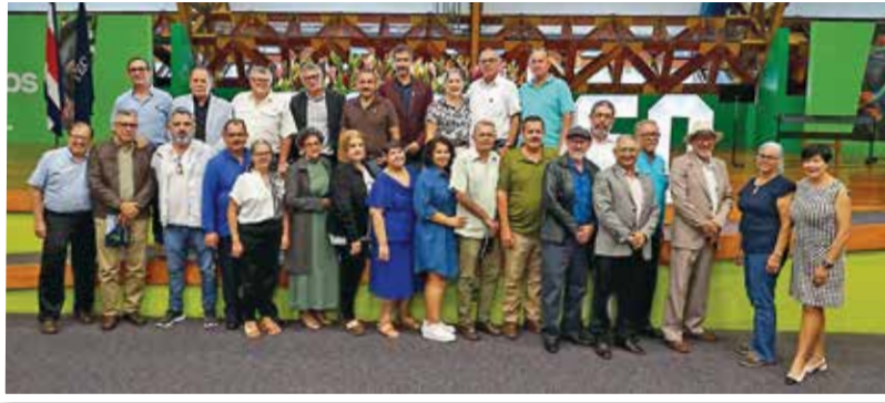
Participación del 50 Aniversario del TEC San Carlos.