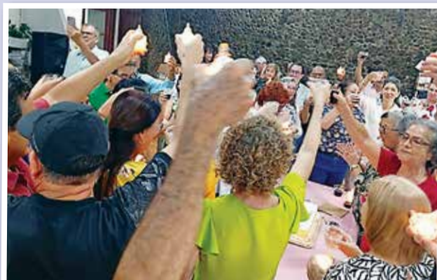
Celebración de cumpleaños.