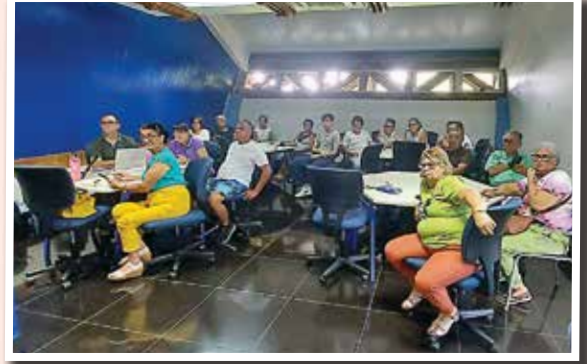
Charla "Mi celular, mi aliado a diario"