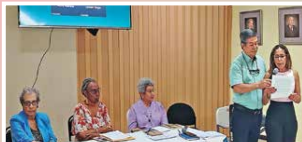
La Comisión de Estilos de Vida Saludable fortalece salud mental, emocional y física entre la membresía

Grupo Grafos Multiservicios SRL. Tel: +506 8392.89.91