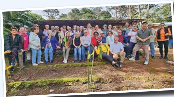
Paseo a Fraijanes.