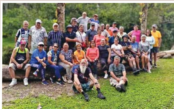
Caminata a Navarro del Muñeco el 25 de setiembre.

E l grupo de la Filial de Cartago disfrutó de variadas y alegres actividades las cuales fortalecen la convivencia y el bienestar de todos sus afiliados y afiliadas.