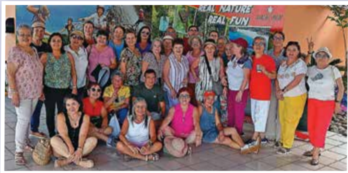
Paseo al Hotel Best Western.

Esperamos que las actividades pendientes como la celebración del Día del Hombre y la fiesta navideña, tengan gran acogida. Deseamos finalmente agradecer la confianza depositada durante el presente año. ●