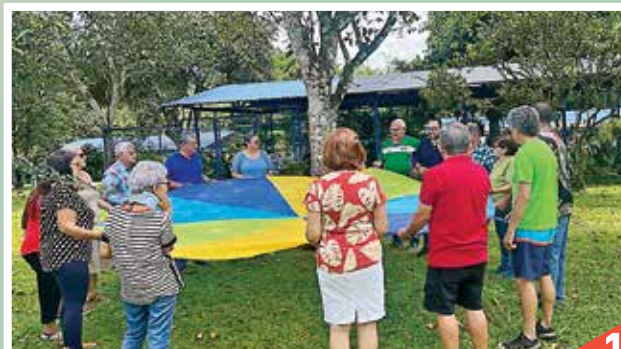
De las Filiales