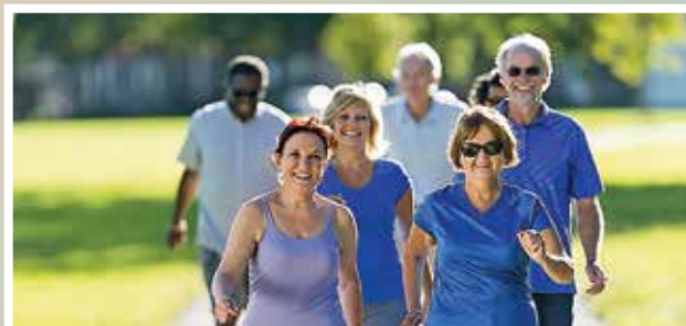
Deterioro cognitivo y su impacto en la funcionalidad de la persona adulta mayor: cómo combatirlo a través del ejercicio