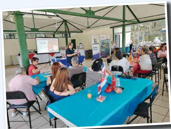
Charlas “Envejecimiento activo” impartido por JUPEMA.