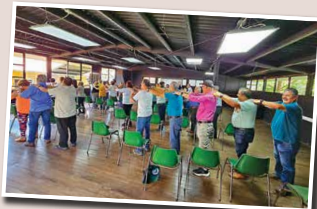
Charlas el 1 de octubre y el 5 de noviembre.