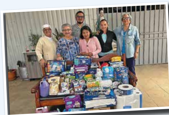
Recolecta del Comité de Solidaridad para centro diurno local.

Finalmente, el 12 de noviembre la Filial realizó un paseo al Parque Recreativo Fraijanes, con la participación de 62 afiliados, quienes disfrutaron caminatas por los senderos y laguna, además de desayuno, almuerzo, refrigerio, bingo y música en un ambiente fresco y ameno. ●